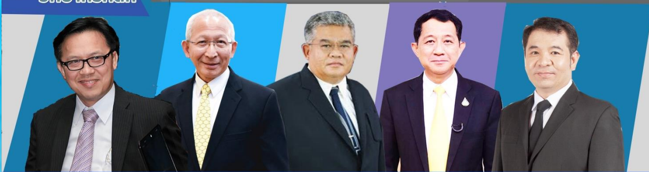
ศ.ดร.สมชาย วงศ์วิเศษ ราชบัณฑิต